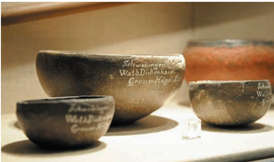
Viele der von Rupp geborgenen Funde, darunter auch die Keramikgefäße vom Dickenhardt, sind heute im Heimat- und Uhrenmuseum Schwenningen ausgestellt.