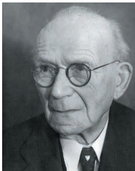
Hermann Rupp (1869–1958).

Der größere Hügel wurde von nordwestlicher Richtung angegraben. Die Hoffnung auf Funde war gering, doch schnell kamen Objekte zutage. In etwa 45 cm Tiefe und 1,5 Metern Entfernung vom Hügel entdeckte Rupp ein Eisenbruchstück, „der Form nach [...] von einer Waffe“. 19 Durch eine „Ungeschicklichkeit“ eines Grabungsarbeiters wurde das Objekt in nicht näher genannter Weise beschädigt. In den zahlreichen Dachsgängen lagen kleinere Keramikscherben, ansonsten blieb die Suche ergebnislos und wurde „nur aus Konsequenzgründen“ 20 weiterverfolgt. Plötzlich stießen die Ausgräber unvermutet auf die Fragmente einer Urne, die unter einem größeren Stein lag. Weitere Scherben und sogar eine komplette Schale folgten. Einen gut erhaltenen Hammelschädel und weitere Tierknochen schrieb man hingegen dem Wirken der Füchse zu. Nach der Grabung wurde der Hügel wieder verschlossen. Durch einen Hinweis der Waldhüter hatte man inzwischen von einem dritten Hügel erfahren, der etwa 300 Meter entfernt lag. Außer einigen Steinen und kleinen Scherben wurde jedoch nichts gefunden, wohl, wie Rupp mutmaßte, aufgrund einer früheren Plünderung.