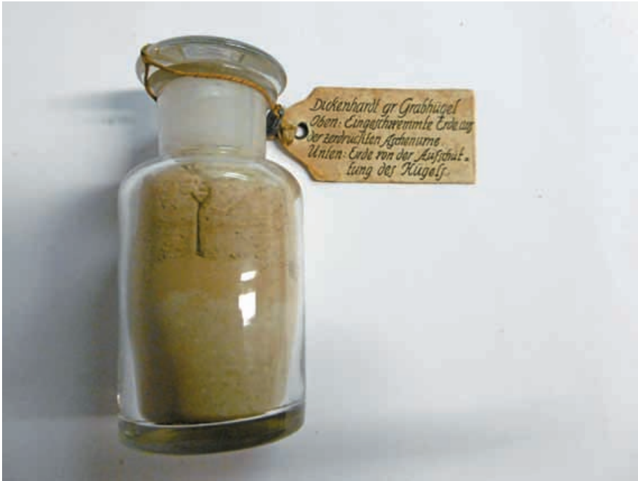
„Eingeschwemmte Erde aus der zerdrückten Aschenurne“ und „Erde von der Aufschüttung des Hügels“ vom Dickenhardt. Heimat- und Uhrenmuseum Schwenningen (Inventar-Nr. 0101).