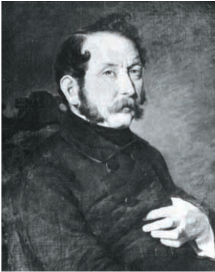
Karl Eduard Paulus (1803–1878).