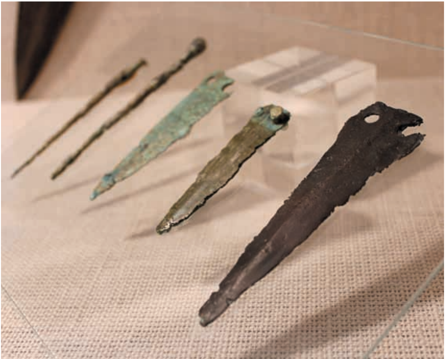
Von Rupp geborgene Bronzedolche im Heimat- und Uhrenmuseum.