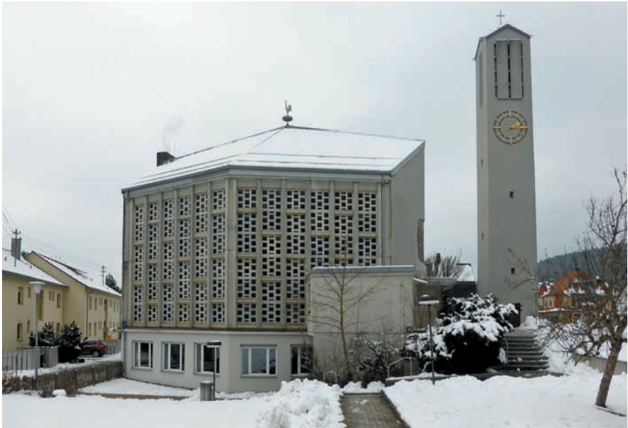
Evangelische Versöhnungskirche in Immendingen. Die Gemeinderäume befinden sich unter dem Kirchenraum.