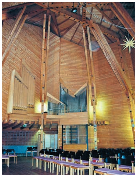
Der Innenraum der Versöhnungskirche.