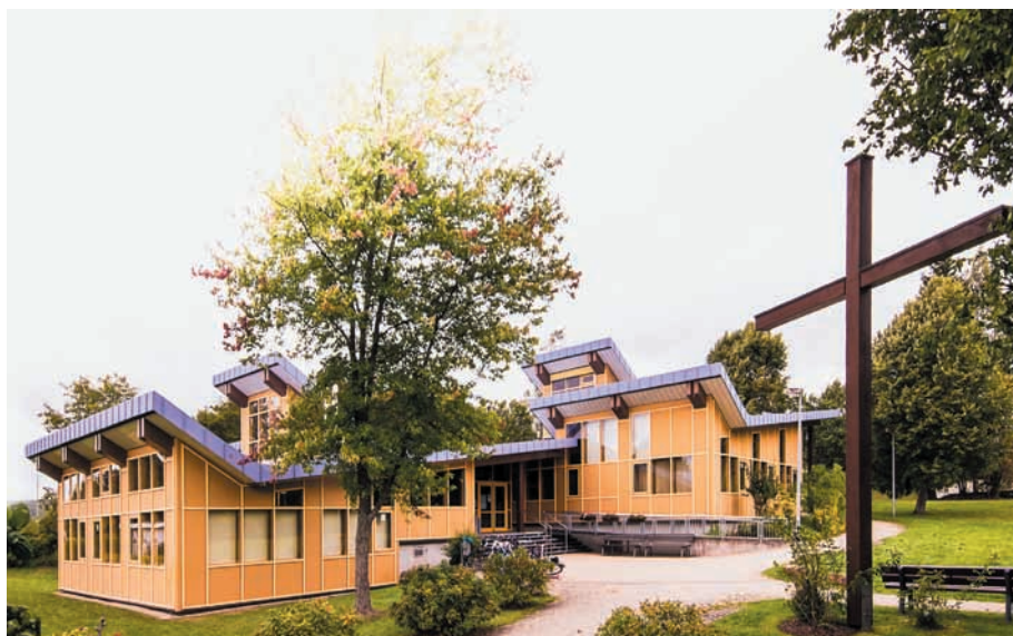
Ökumenisches Gemeindezentrum in St. Georgen im Schwarzwald.