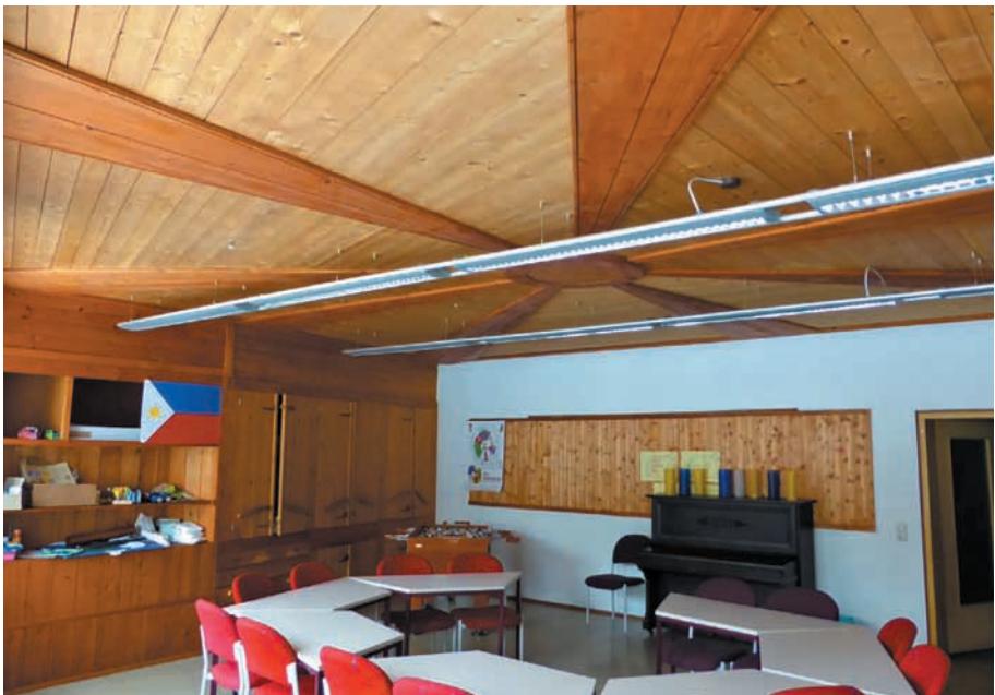
Ein Gemeinderaum der Versöhnungskirche in Immendingen.