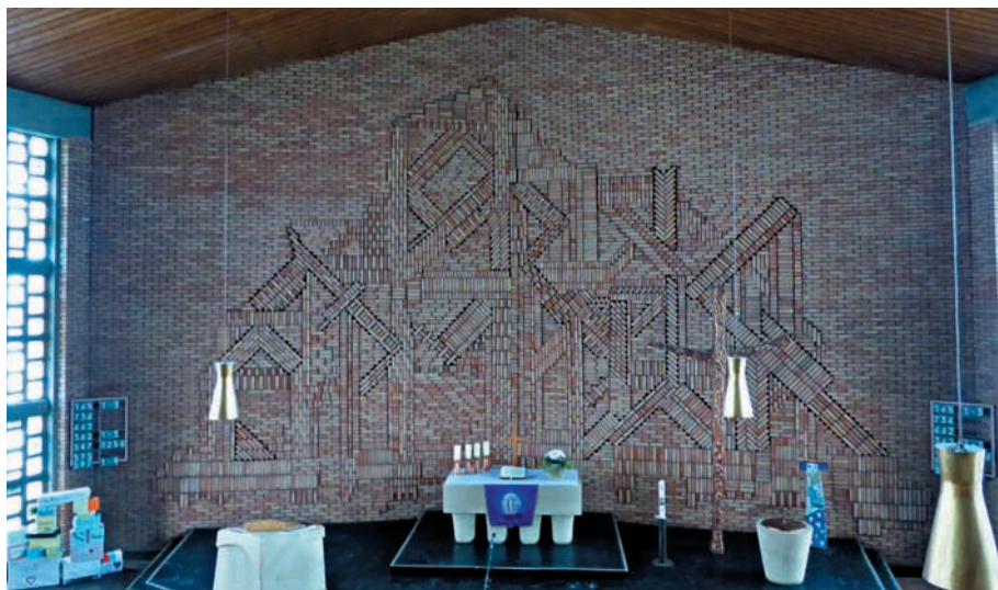
Die Altarwand der evangelischen Versöhnungskirche in Immendingen.

Von über Lichtbänder unter der Traufe geschaffene Geborgenheit oder im gläsernen Schrein durch getönte Dickglaswände erzeugte mystisch-sakrale Stimmungen abweichend, konzipierte Horst Linde in seinem Entwurf für die