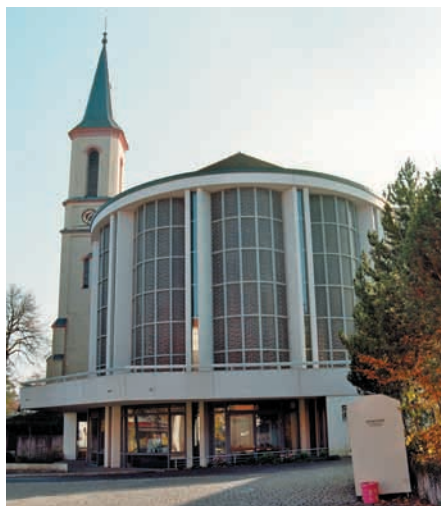
Katholische Kirche St. Johann in Bad Dürkheim.