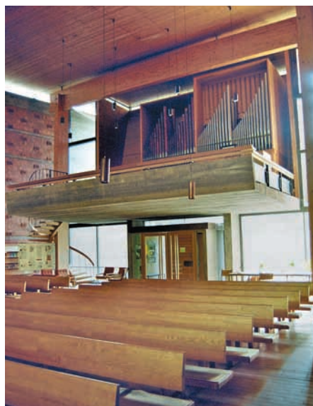
Empore der Johanneskirche Bad Dürrhein.

Die Architektursprache ist in Material- und Formenwahl darauf ausgerichtet, den Eindruck von Leichtigkeit und Schwerelosigkeit massiver Bauteile zu erwecken. Das Eingangsportal ist von einem schmalen Lichtband eingefasst. Es versetzt das große, schräg vorkragende Tympanon in einen optischen Schwebezustand. Um die materielle Schwere der Holzwand nicht zu stören, hat Hans Mettel das Motiv „Wen da dürstet, der komme zu mir und trinke!“