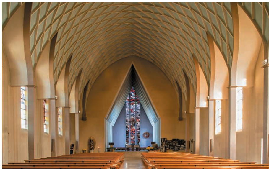
Blick in das Kirchenschiff der katholischen Marienkirche in Donaueschingen.