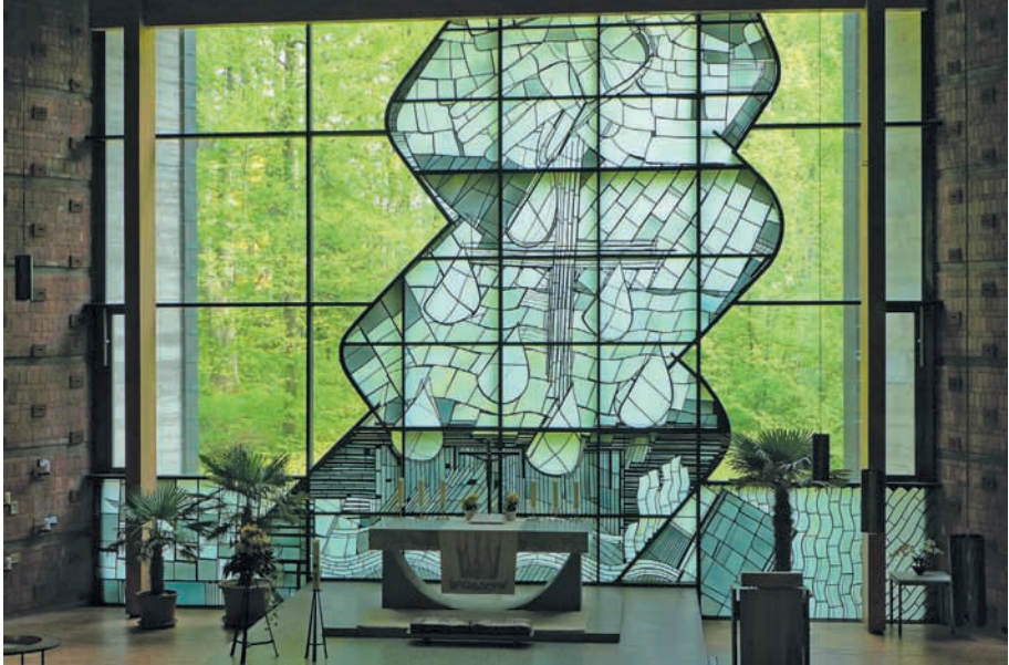
Das große Sichtglasfenster hinter dem Altar der evangelischen Johanneskirche Bad Dürrenheim.