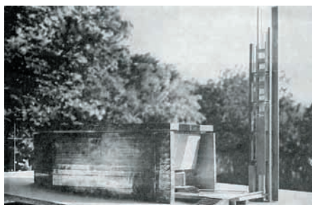
Modell der Johanneskirche Bad Dürrhein.