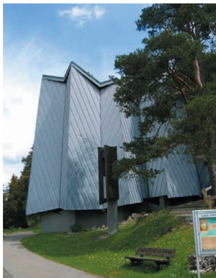
Evangelische Versöhnungskirche in Marbach.