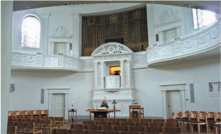
Blick in das Innere der Donauessinger Christuskirche.

bührendem Abstand zu Kanzel und Altar und setzte in den Schnittpunkt der Gänge vor Altar und Kanzel den Taufstein als Sinnbild für die Aufnahme des Täuflings in die Gemeinde.